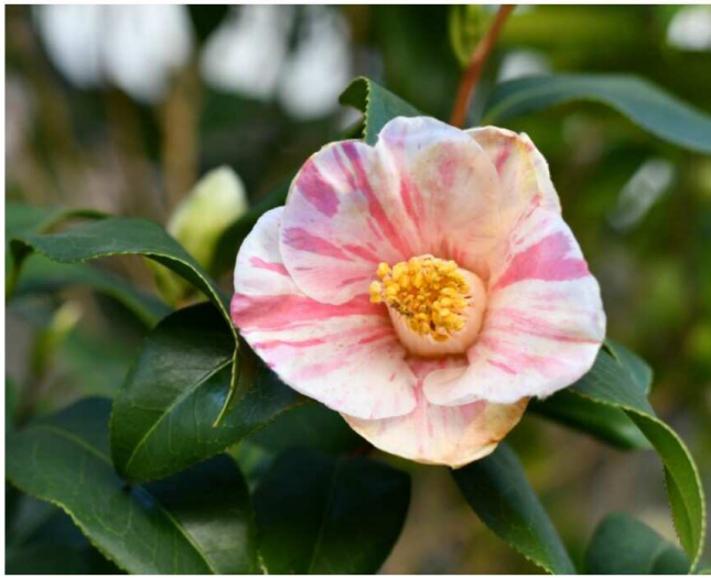
団地の庭に咲く小ぶりのツバキ

私は北海道出身で、お正月には赤い酢だこを食べないで新年になった気がしない。でもこの物価高で昨年よりかなり高くなっている。ささやかなお祝いも味わえなくなりそう。 領別所・磯野