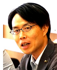
市議2期目で共産党さいたま市議団の幹事長。議会ではまちづくり委員、議会運営委員。